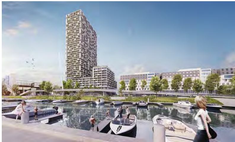
Der Marina Tower entsteht aktuell am Wiener Handelskai. – Zechner & Zechner